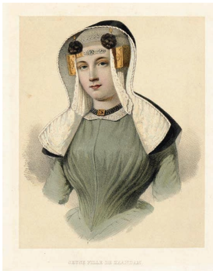
Fig. 2: Zaanse streekdracht rond 1800. Lithografie door François Buffa, & Fils.

'Dutchman, lazier than any other race of mankind'